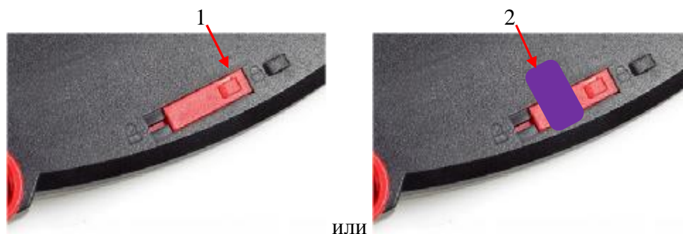
Рисунок 2 – Схема пломбировки от несанкционированного доступа, обозначение места нанесения знака поверки (1 – свинцовая или пластиковая пломба со знаком поверки в виде оттиска поверительного клейма; 2 – пломба, знак поверки в виде разрушаемой наклейки)

Маркировочная табличка весов крепится клеевым способом на нижней или боковой поверхности весов и содержит следующую информацию (рисунок 3):